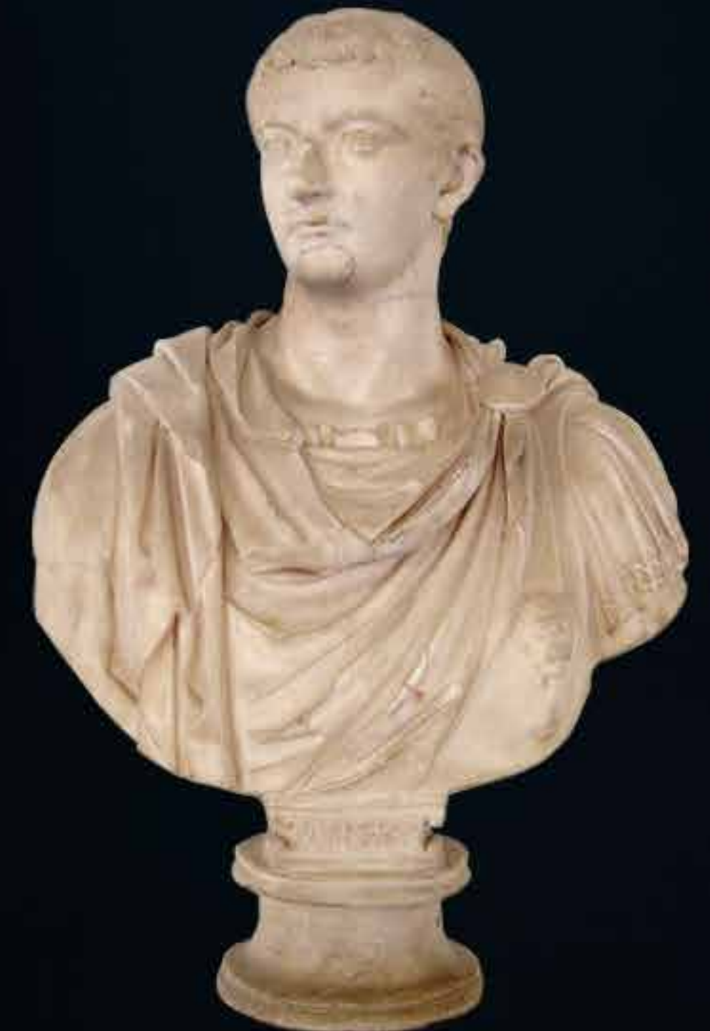
TIBERIO Octubre - Diciembre