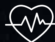
Plan Gastos Médicos Mayores